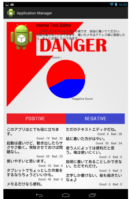
ダウンロード画面